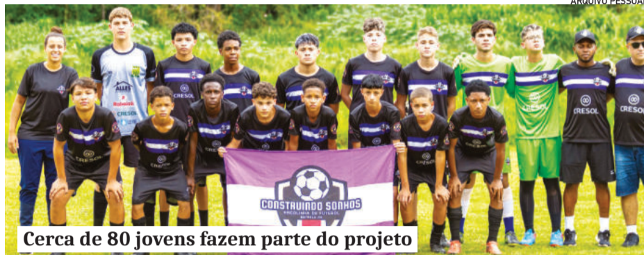
Cerca de 80 jovens fazem parte do projeto

Segundo ela, a iniciativa também começa a abrir espaço para a participação feminina. "Temos meninas que treinam e a ideia é ampliar ainda mais. Quem vier será bem acolhida, com toda a certeza", comenta.