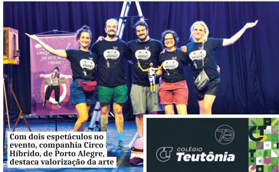
Com dois espetáculos no evento, companhia Circo Híbrido, de Porto Alegre, destaca valorização da arte

A programação do Sesc Circo é gratuita e os ingressos estão disponíveis on-line no site sescrs.com.br . Mesmo com lotação em alguns horários, o público pode acompanhar atividades abertas no entorno, além de feira de artesanato, espaços de convivência e apresentações ao ar livre.