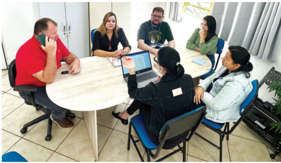
Reunião realizada nesta sexta-feira definiu a cedência de mais duas salas para o Ensino Médio, prazo que se estende até dezembro