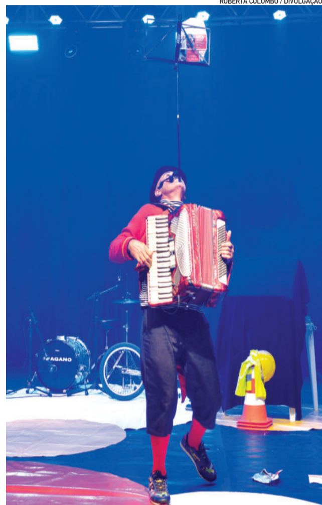
Espectáculos combinam teatro, humor e técnicas circenses