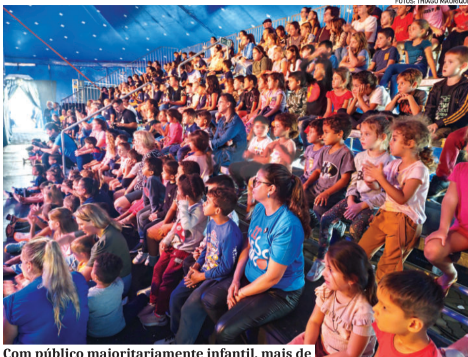
Com público majoritariamente infantil, mais de 27 mil pessoas devem prestigiar as apresentações

A resposta da comunidade aparece nos números e na ocupação dos espaços. A expectativa é de cerca de 27 mil pessoas ao longo da programação, com sessões lotadas e atividades paralelas para atrair o público também fora da lona principal. "A grande participação das pessoas nos desafia a pensar em como