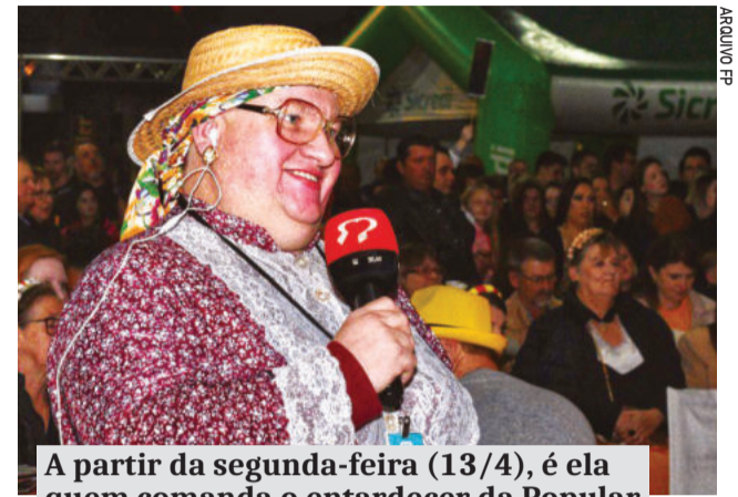
A partir da segunda-feira (13/4), é ela quem comanda o entardecer da Popular

A personagem tem histórico na Rádio Popular. Atuou como repórter na Festa de Maio de 2022, quando entrevistou o público. De-