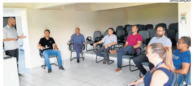
Entidade realizou reunião para debater o assunto

Considera que é preciso avaliar os comércios a partir de diferentes realidades. “O comércio de Teutônia não é igual o comércio de Porto Alegre. Teutônia não tem um comércio muito volumoso, com aglomeração de pessoas”, exemplifica. Assim, avalia que quando o governador tira o direito do prefeito de decidir sobre a sua