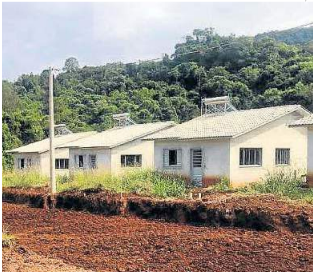
Obras nas ruas do Loteamento 10 de Abril