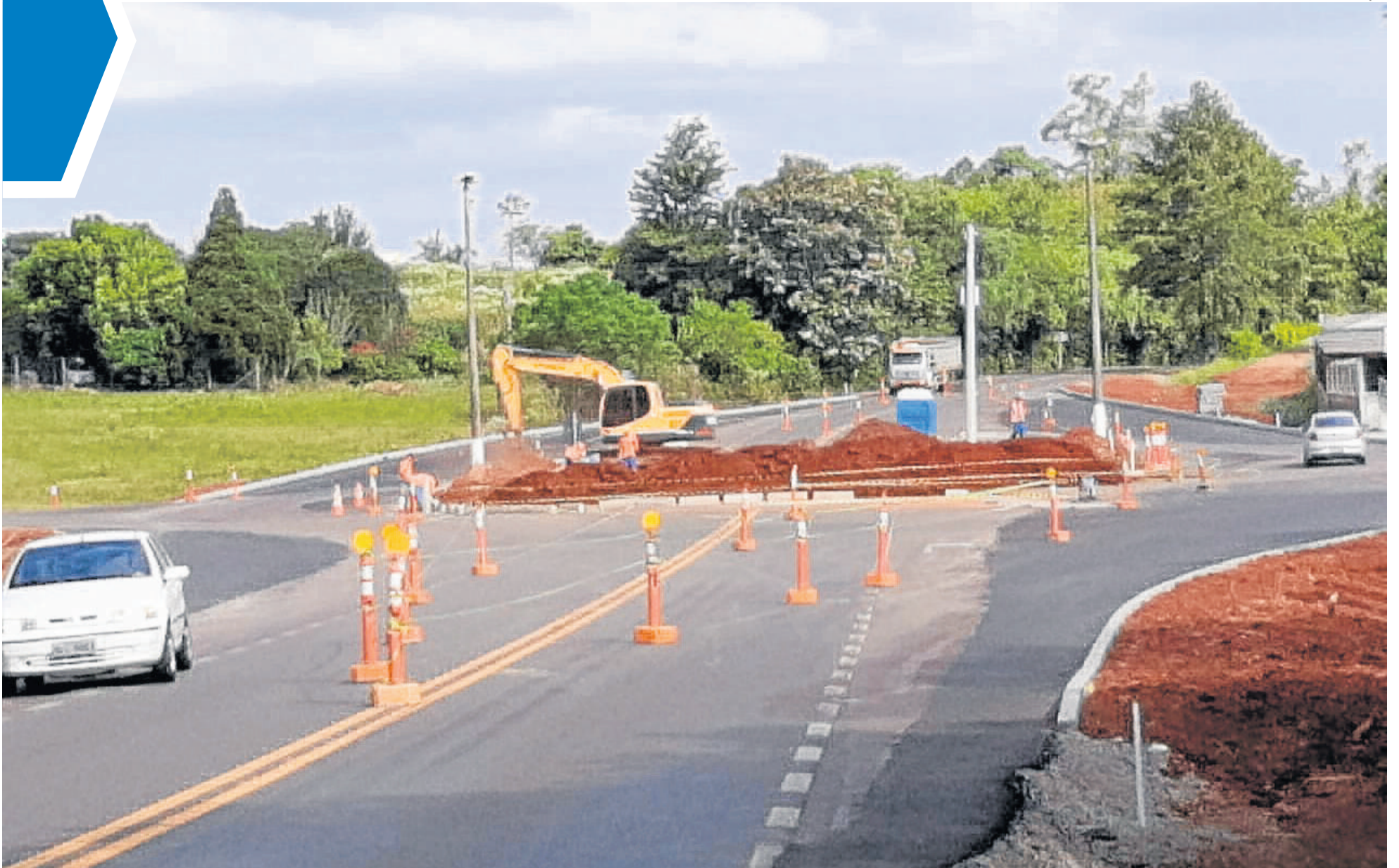
Com obras do canteiro central, traçado da rótula já mudou