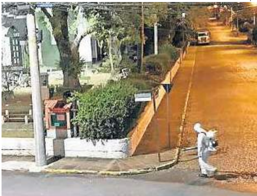
Bombeiros Voluntários atuam na prevenção ao coronavírus