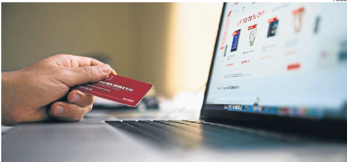
Vendas podem ser feitas pela internet, inclusive através das redes sociais

As empresas interessadas fazem a inscrição no Portal de Rodadas: www.sebraers.com.br/rodadasdenegocios . Neste portal, elas colocam os produtos e serviços que desejam ofertar ou demandar, ou propostas de parcerias. O Sebrae disponibiliza também materiais e palestras no site www.sebraers.com.br/coronavirus .