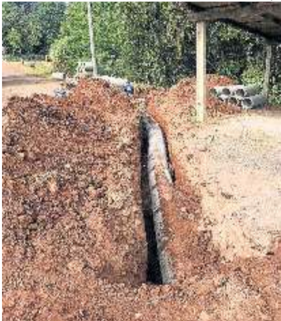
Trabalhos iniciam na Rua do Moinho

Em Linha Ernesto Alves - Seca Baixa - já foram executadas a limpeza, a abertura de valas, a colocação de tubos e a remoção de solos ruins. Em seguida, foi finalizada a terraplanagem com aterro, nivelamento da pista e compactação. Agora o trecho está pronto para receber o pavimento de rachão e depois o asfalto.