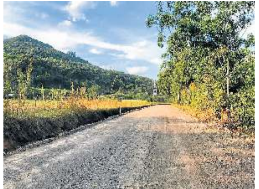
Na Seca Baixa, obras de pavimentação também estão em andamento