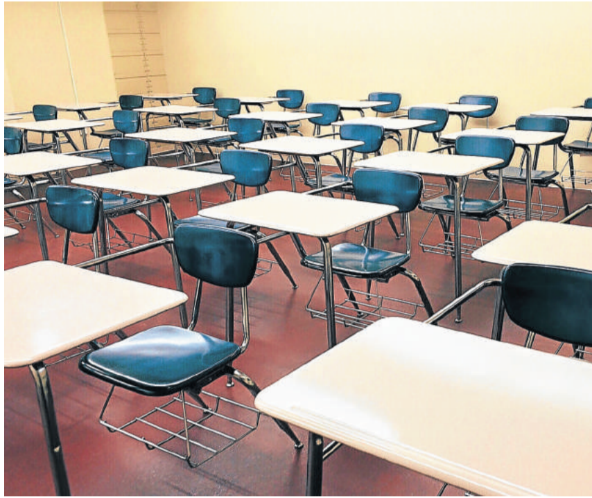
Salas de aula ficam vazias por mais um mês

Para evitar que os alunos da rede estadual sejam prejudicados, foi implementada a metodo-