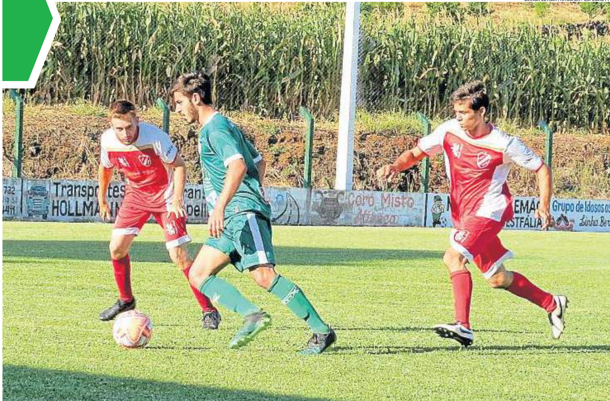
Copa 35 anos da Aslivata encerrou a primeira fase e aguarda retomada para os jogos eliminatórios