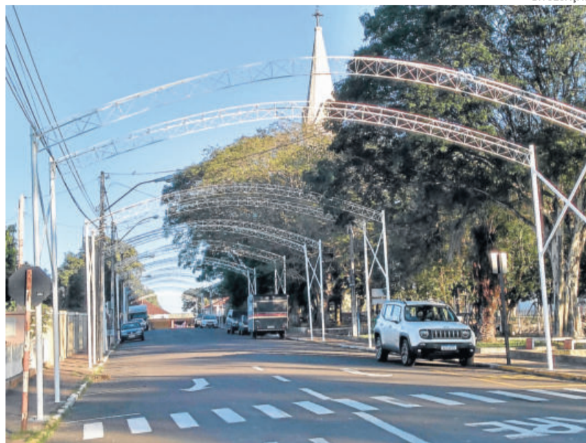
Arcos foram instalados nesta semana, já melhorando o aspecto da via

A revitalização contempla a quadra entre as ruas Asido Dreyer e Daltro Filho. Cinco dos 10 arcos instalados estavam na Rua Capitão Schneider, no Bairro Canabarro, e foram reformados e reaproveitados no Bairro Teutônia. Os outros cinco arcos são