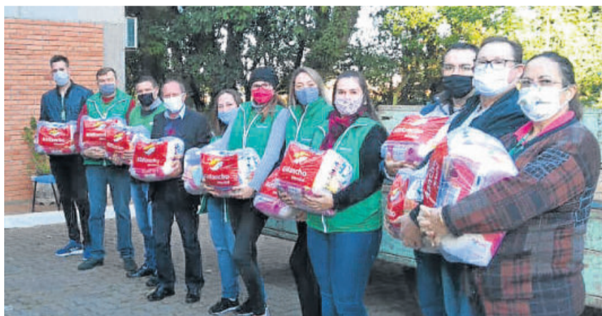
Entrega das cestas básicas em Fazenda Vilanova

(26/05). Para cidade de Fazenda Vilanova, 29 cestas básicas foram doadas para o CRAS na quarta-feira (27/05). Ambas ações contaram com o apoio do Banco de Alimentos, instituição que combate a fome no Brasil há mais de duas décadas.