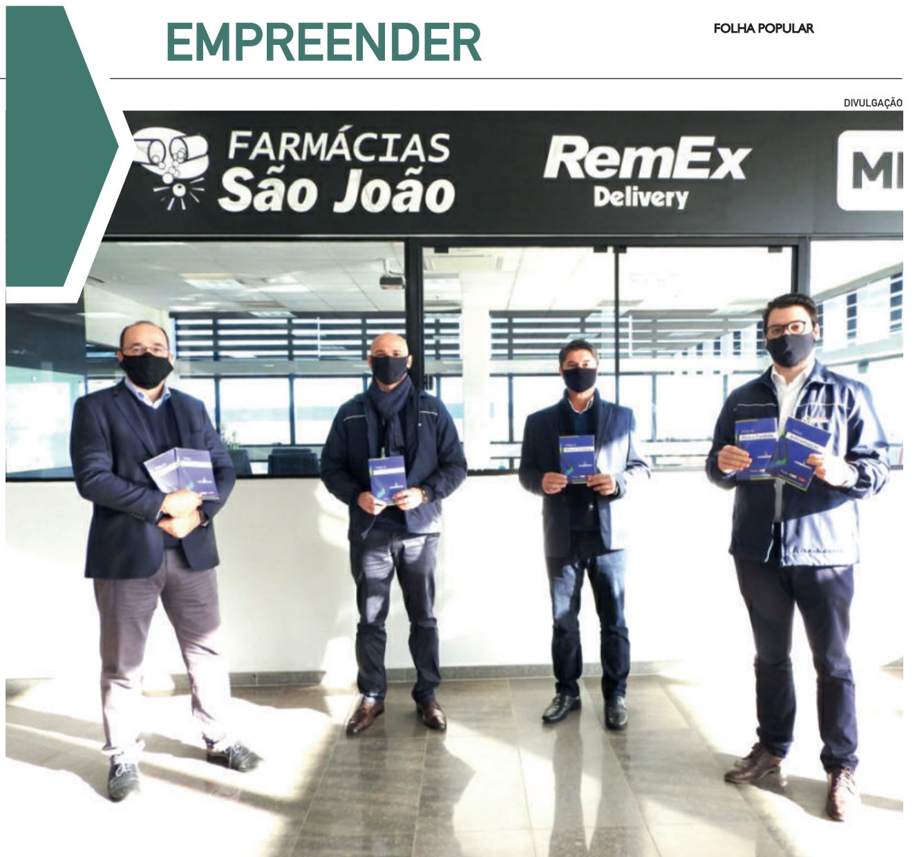
Comitê de Compliance foi implantado na Rede de Farmácias São João

Não se sabe quando a recuperação irá iniciar, mas, "o futuro, para os valentes, é a oportunidade". Vitor Hugo