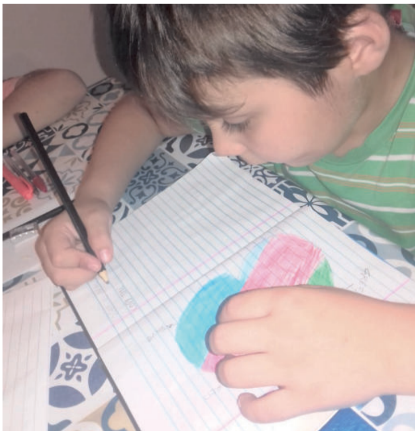
Alunos da Emef Leo Pedro Schneider recebem atividades a serem feitas em casa

Com duas semanas de envio de material, a equipe diretiva e os professores fizeram uma reunião para avaliar o andamento das atividades. “Desta proposta podemos dizer que estamos fazendo o nosso melhor e colhendo bons frutos num momento tão delicado para a educação e para o ser humano em que escola e família estão juntas, unidas num único objetivo: o bem dos alunos”, pontua.