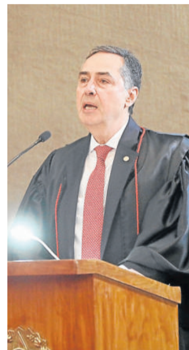
Ministro Luís Roberto Barroso