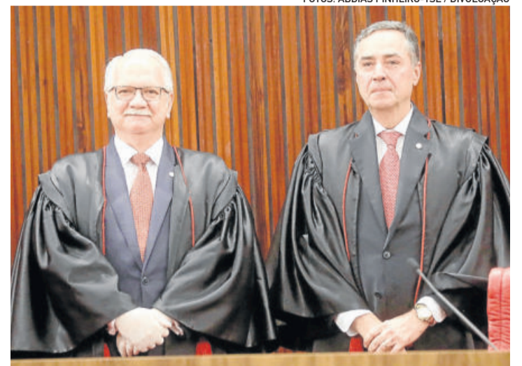
Ministros Luiz Edson Fachin (e) e Luís Roberto Barroso

Ao levantar essa questão, e “sem querer provocar nova ferida narcísica na condição masculina, observo que dois dos países que melhor se saíram no enfrentamento à pandemia foram a Nova Zelândia e a Alemanha”, ambos liderados por mulheres. Assim, Barroso considera que atrair mulheres idealistas e competentes para a política é uma importante demanda do país, citando que elas são metade da população. “Somos um país multiétnico, multirracial e multicultural, precisamos da consciência de que isso é uma virtude, um privilégio, que a história nos deu”, conclui.