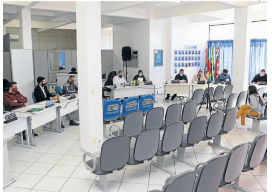
Tribuna segue acontecendo nas mesas dos vereadores, como medida de prevenção

enxergar oportunidades não vistas antes. Que possamos valorizar o que é daqui, da nossa terra, que juntos possamos engrandecer cada dia mais a nossa cidade”, sugere.