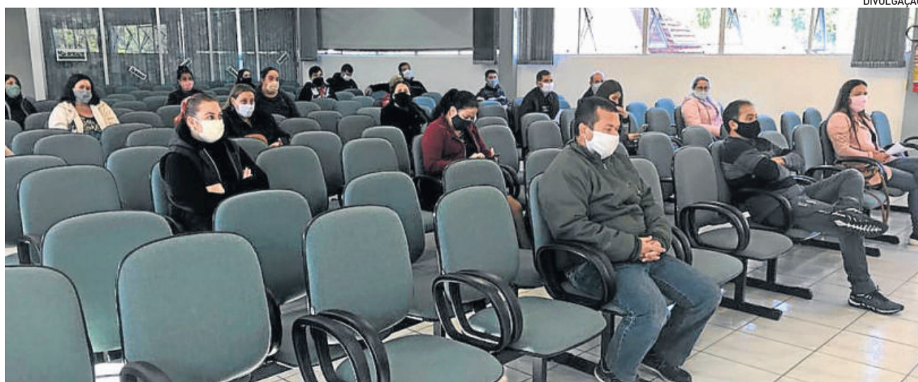
Ex-funcionários da RR Shoes receberam orientações da Justiça do Trabalho