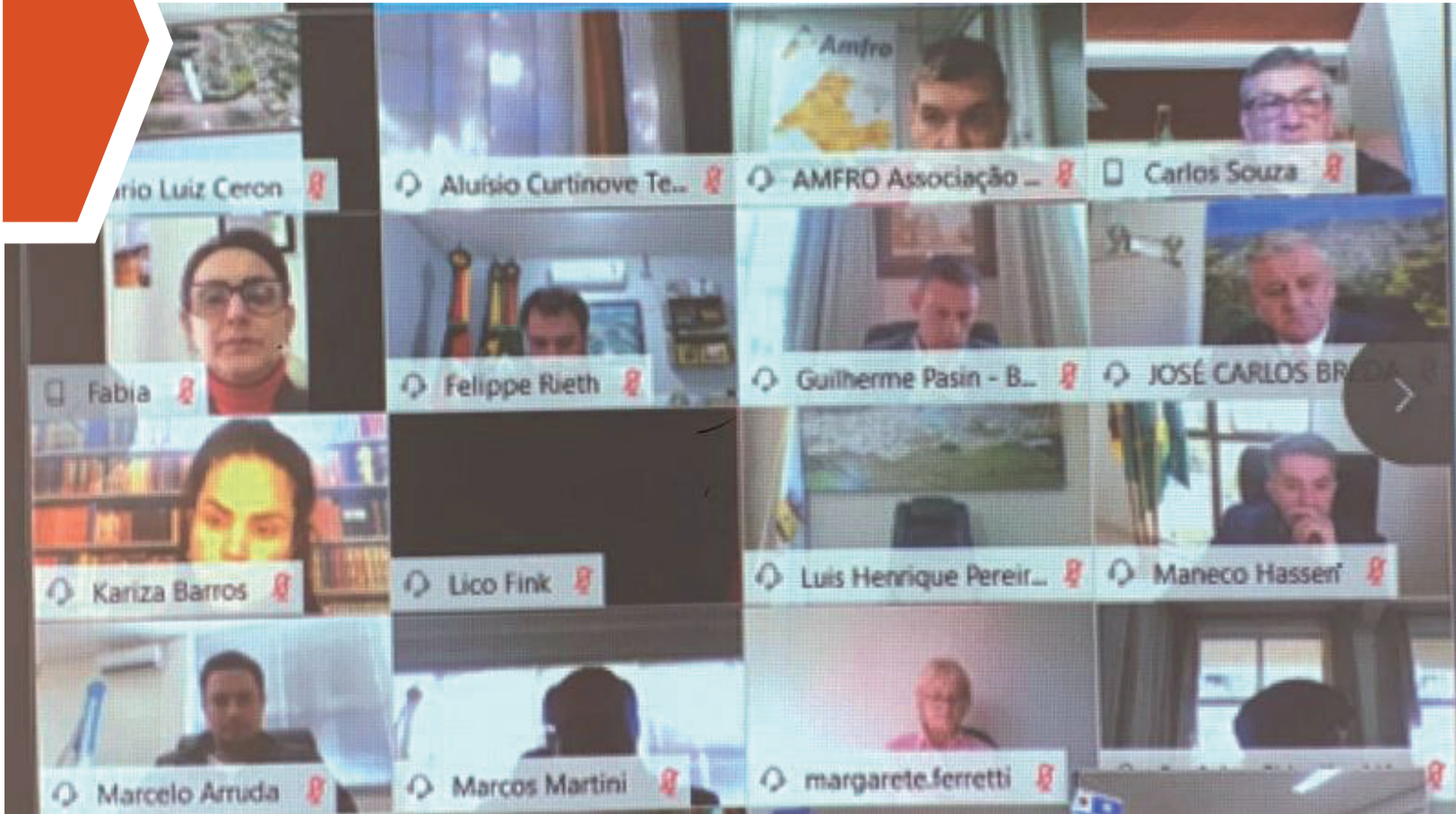
Associações de municípios estiveram reunidas nesta semana com a Famurs