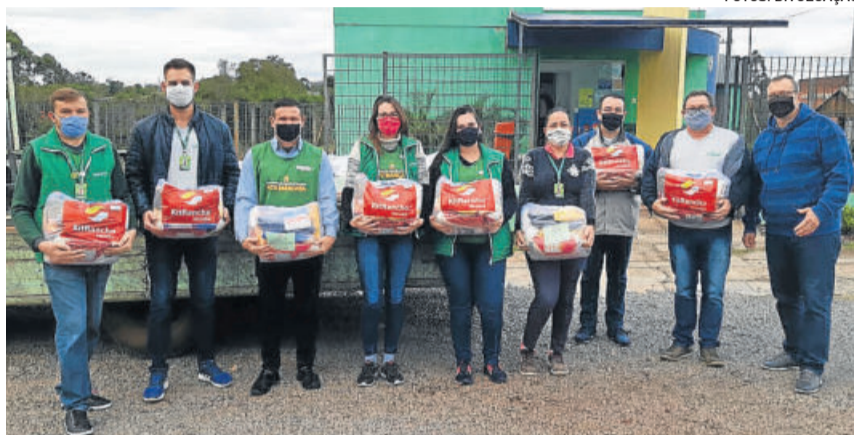
Entrega das cestas básicas em Teutônia

Somente com o valor arrecadado para cidade de Teutônia, 50 cestas básicas foram doadas para o Centro de Referência de Assistência Social (CRAS), com a entrega na terça-feira