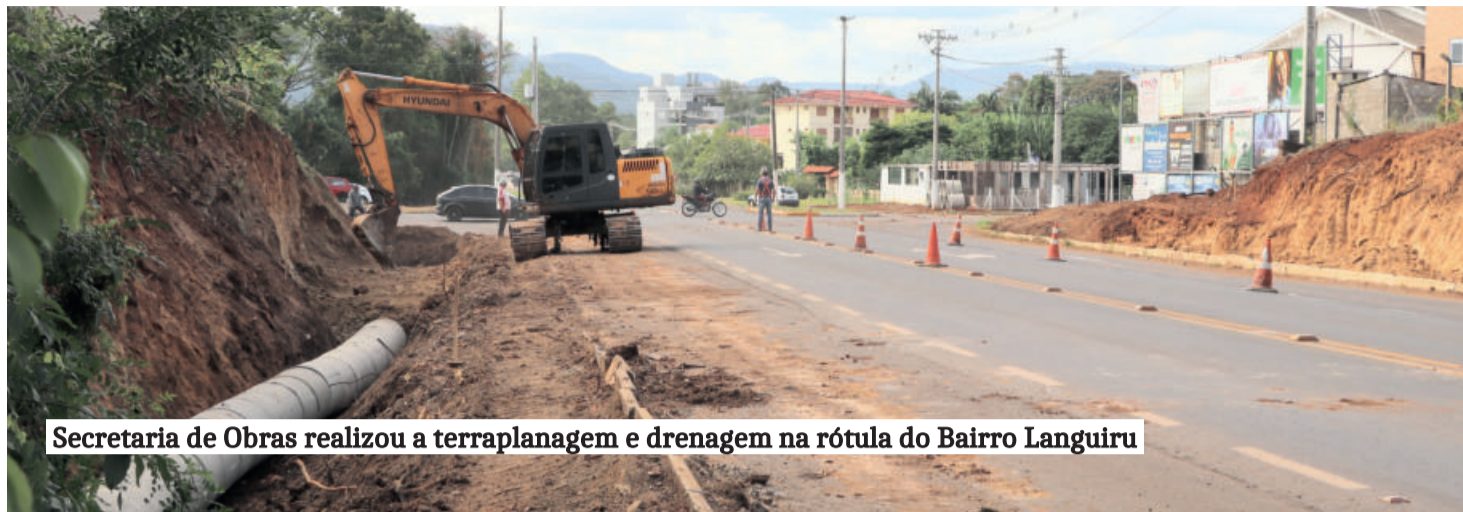
Secretaria de Obras realizou a terraplanagem e drenagem na rótula do Bairro Languiru