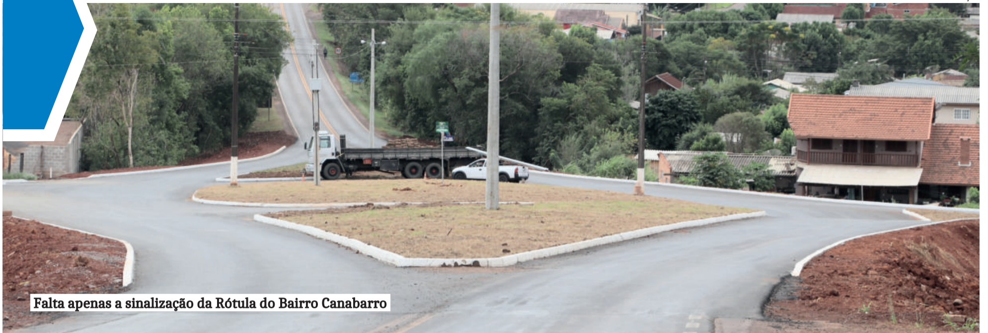
Falta apenas a sinalização da Rótula do Bairro Canabarro