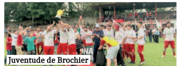
Juventude de Brochier