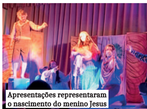
Apresentações representaram o nascimento do menino Jesus