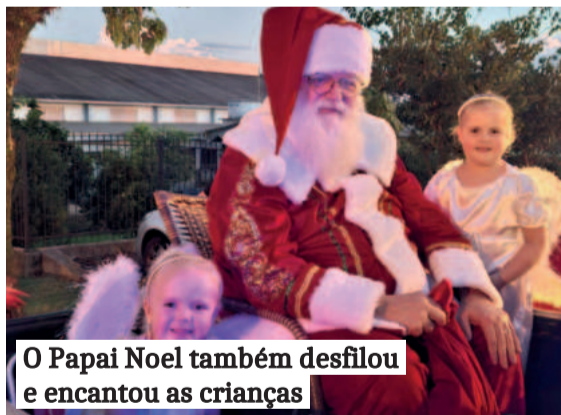
O Papai Noel também desfilou e encantou as crianças

PASTORA DA COMUNIDADE EVANGÉLICA DE CANABARRO