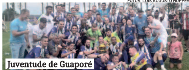
Juventude de Guaporé