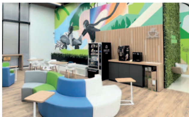
Aconchego do espaço de convivência traz sensação de casa à comunidade