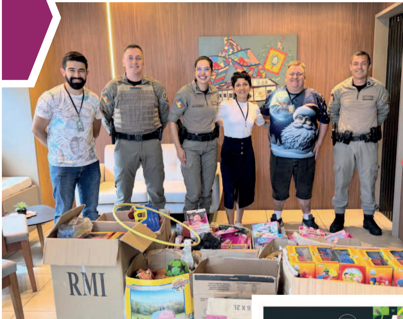
Última entrega foi feita na Brigada Militar de Teutônia e fará parte do projeto Natal das Crianças