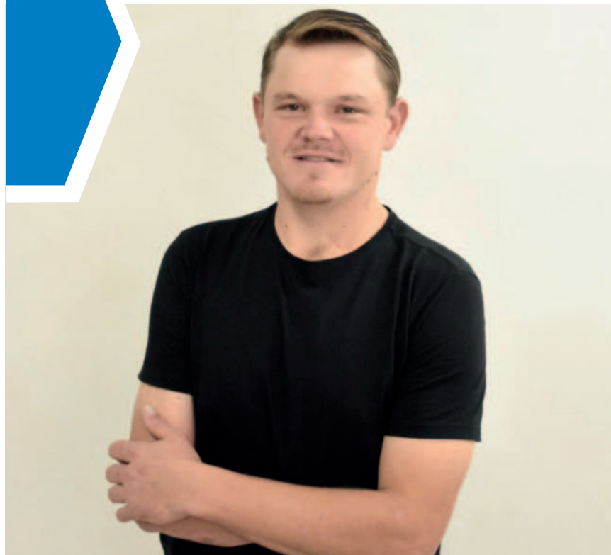
A doação é uma parceria com o projeto Mãos Solidárias do Rotary Club de Maringá